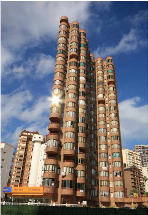
Unter all den mittelmäßigen Gebäuden findet sich auch die eine oder andere namenlose Perle.