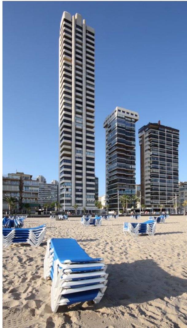
Links: Vorteil der extrem schlanken Hochhäuser: Die Wohnungen sind optimal besont.