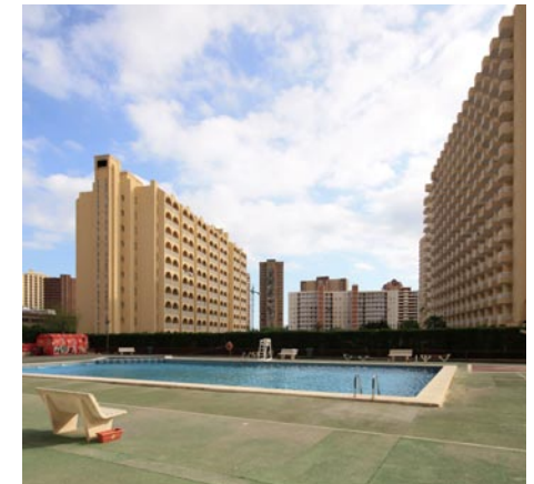
Links: Strandspaziergang an der Playa del Levante.