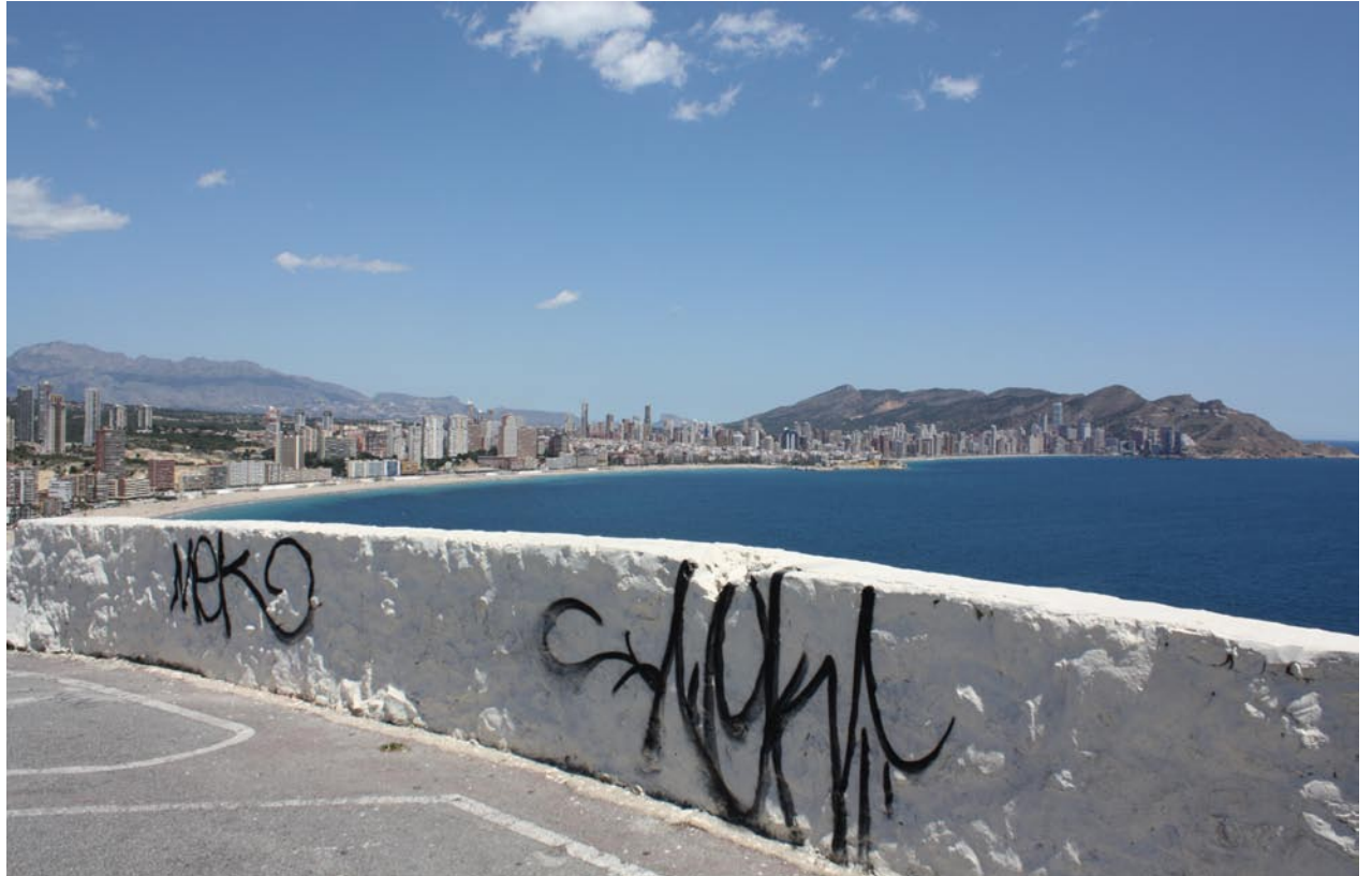
Ein wenig Großstadtflair: Graffiti am Mirador de la Cala.