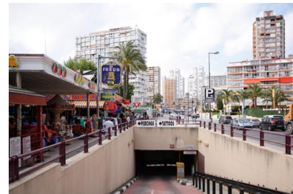
Oben: „Beniyork“ vor der Kulisse der Sierra de Aitana.