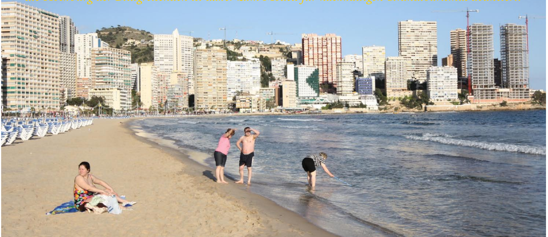
Abend an der Playa del Levante

Viele halten Benidorm für die größte Bausünde an der Costa Blanca. Mit ihrer austauschbaren Architektur und hohen Rückseitendichte ist die Touristenstadt in der Tat nicht unbedingt hübsch, aber dafür sind ihre Hochhäuser im Vergleich zu üblichen Feriensiedlungen äußerst platzsparend. Ausgerechnet die Hochburg der Billigreisenden ist daher zum Modell für nachhaltigen Strandtourismus avanciert.